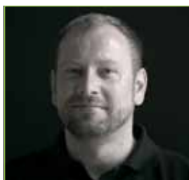
ING. ARCH. JAROSLAV WERTIG A69 - ARCHITEKTI

When we were looking for a way of stylishly expressing the essence behind the Central Park Praha project during preparations for a retrospective exhibition of our studio's work, we came across a night shot of the interior of one of Pierre Koenig's most renowned villas in Los Angeles from 1961. From the glass pavilion of the villa, its inhabitant observes the lit-up Los Angeles far below. We immediately realised that this was exactly the exceptional feeling that we wanted CPP inhabitants to experience. Relax; the capital is at your feet.