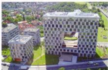
Rezidence Kavčí Hory, kterou navštívil architekti z kanceláři A.D.N.S., je díky svému „vyřizování“ hranou jednou z nejzajímavějších pražských staveb.

Při dlouhých pohledech nepřiblíží jako bariéra, ale připomíná spíše příjemně poskládanou stavebnici.