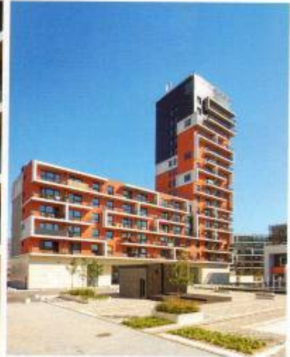
Edy si tady vařilo pivo, nyní se v areálu Hořelostického pivovaru luxusně bydlí.