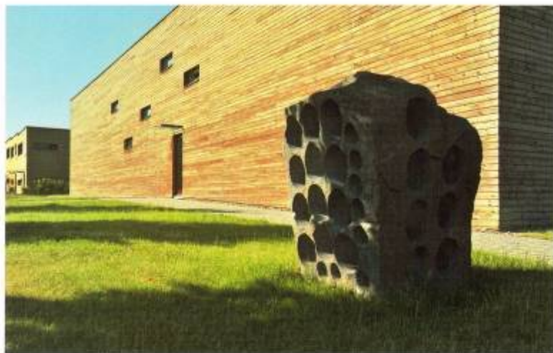
Kolonie Pod Kozincem vznikala před deseti lety jako svého druhu sociální experiment. Povedl se.