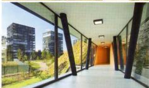
Central Park na pražském Žižkově představuje jeden z vrcholů současného rezidenčního bydlení, kde se spojuje architektura s tvorbou krajiny.

Každý byt má krásný výhled do tří stran a dá se obejít po terase.