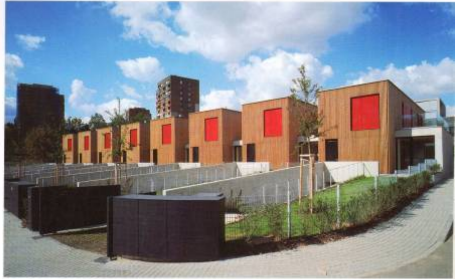
Kolekce klíbových řadových domů obytného souhrnu. Na Kránci, odkud je to blízko do Diskové Sírky.

Jurášek, Martin Němec, Juraj Sonlajner a Tomáš Drašner) se totiž rozhodli ke kroku, který v Česku dosud nebyl vůbec obvyklý: z hranołu hlavní budovy vynechali mezi třetím až osmým podlažím část jeho hmoty, takže vznikl hluboký otvor, přes nějž lze vidět jako skrz obří kukátko. Dům se nachází na konci ploché planiny a na začátku terénního zlomu spadajícího do vltavského údolí, takže to má své opodstatnění – naznačuje to předěl a změnu dosavadního stavu. Není to bariéra, ale spíš bytelné okno. Architektura, která chce být nadprůměrná, takovou „hraniční situaci“ zpravidla odráží. Navíc funguje jako světlík pro řadu bytů, které můžou dostat svou porci přirozeného světla – čím jsou položeny výše, tím větší mají rozměry. Ozdobou rezidence je penthouse v posledním, dvanáctém patře s monumentální terasou, třemi obývacími prostory, dvěma ložnicemi, saunou a vlastním šestimetrovým bazénem s protiproudem, z něhož je výhled na celou Prahu.