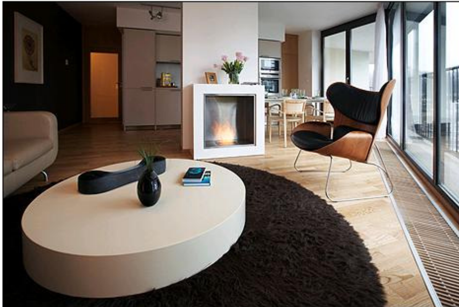
Třicetimetrovému obývacímu s kuchyní dominuje krb