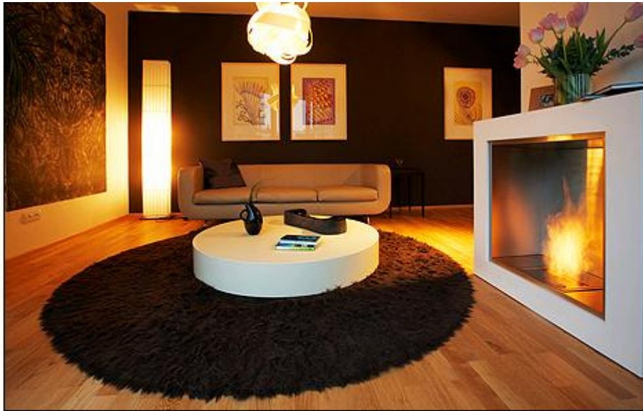
Nábytek volili majitelé z kůže