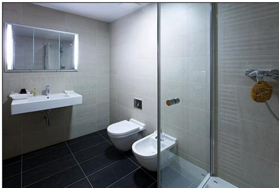
Majitelé zde mají k dispozici kromě toalety i bidet

Ke každé ložnici patří i vlastní koupelna. Do jedné se chodí přímo z ložnice, do druhé z chodby. Mohou ji tak používat i návštěvy. Tomu se také přizpůsobilo zařízení. Majitelé mají u své ložnice k dispozici kromě umyvadla i sprchový kout, toaletu a bidet. Druhá, která má sloužit dětem, je pak vybavená vanou. Přece jen je na mytí dětí praktičtější.