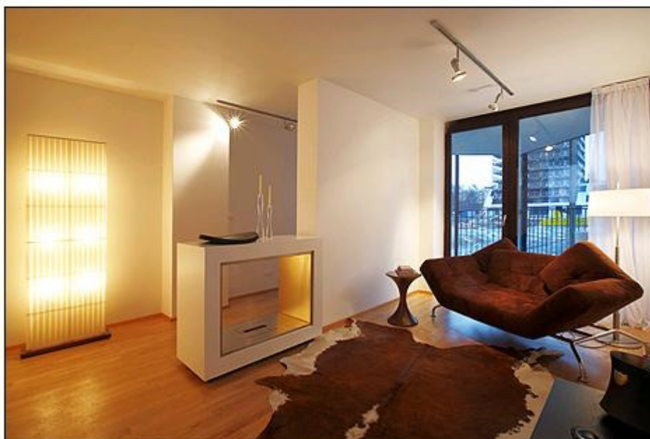
Druhá z ložnic je zatím zařízena jako pokoj pro hosty

Diagonální natočení celého domu se podepsalo na dispozicích bytů – jejich půdorys spolu s balkony kopíruje tvar trojúhelníku. To se – spolu s prosklenými stěnami – promítá i do zajímavého řešení interiéru.