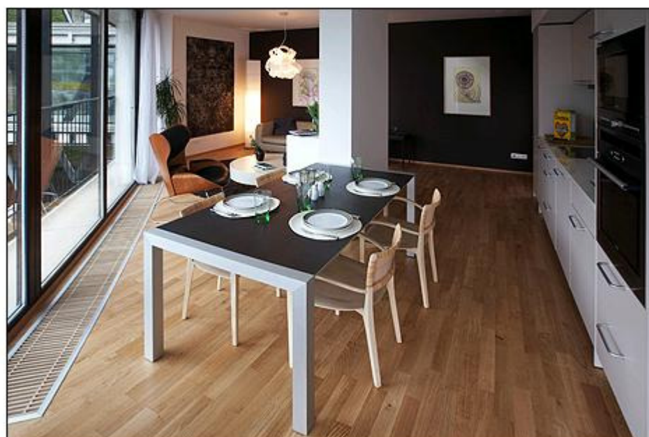
Celý interiér je laděn do přírodních barev